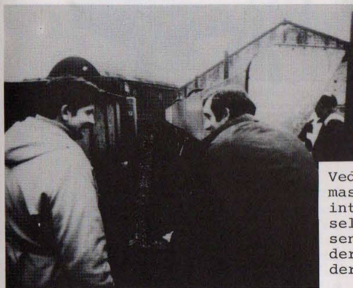
Så er der serveret.

Mange britiske landmænd venter nu på at høre nærmere om dette første forsøg - bl.a. 11 godsejere med mellem 200 og 400 køer hver, som på initiativ af det britiske Milk Marketing Board (en halvstatslig rådgivnings- og opkøbningsinstitution) selv havde bedt om at få lov at se og høre noget om stråmixsystemet. Dette selskab havde vi som gæster i weekenden 2. og 3. februar, og vi venter at finde måske den næste stråmixkunde blandt disse farmere.